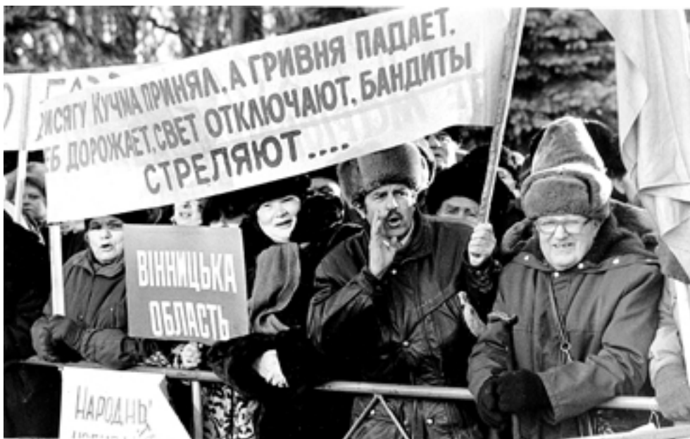
Кучма склав присягу, але справи щоразу погіршуються...

До того ж, із легкої руки Адміністрації, у кожному міністерстві поруч з міністром з'явилися нові адміністративні фігури — державні секретарі.